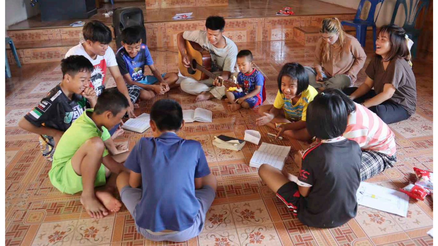
De luaspråkiga böcker, sånger och bibelberättelser som har tagits fram genom samarbetet mellan Finska Missionssällskapet och Thailands evangelisk-lutherska kyrka används flitigt i luaförsamlingarnas lördagsklubbar för barn och unga.

Samtidigt är kyrkans medarbetare också ett exempel på trofasthet. De fortsätter sitt arbete trots att förhållandena ofta är utmanande: ibland är bergsvägarna hala under regnperioden, ibland råder det torra. Byborna drabbas av sjukdomar, avstånden är långa och resurserna få. Guds kärlek