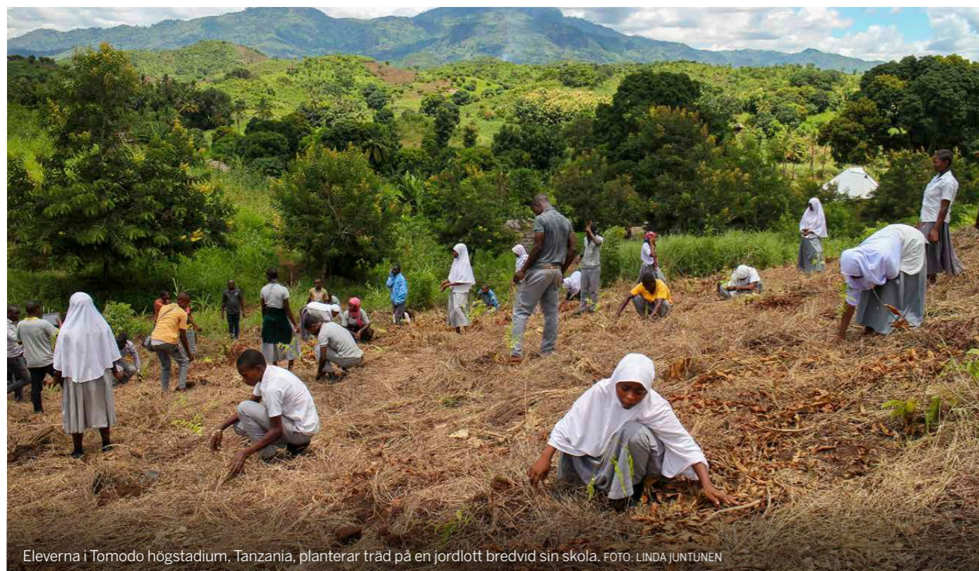
Eleverna i Tomodo högstadium, Tanzania, planterar träd på en jordlott bredvid sin skola.

• 75 skolor anpassades för att bättre lämpa sig för personer med funktionsnedsättning.*