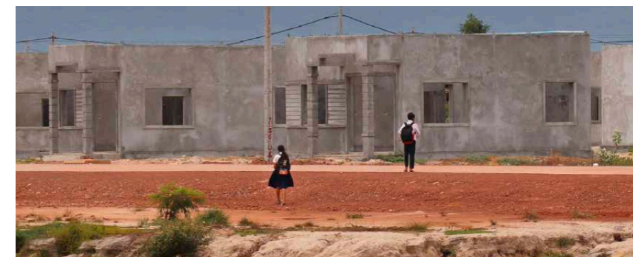
Två skolbarn går genom ett område där invånarna har tvångsflyttats i Kambodja. Missionssällskapet har bedrivit barnskyddsarbete tillsammans med sin partnerorganisation First Step Cambodia sedan 2024. Hjälpen har bland annat nått tvångsflyttade familjer i provinsen Siem Reap.

Hundratals människor har dött i de katastrofala översvämningarna i Pakistan under sommaren och hösten. I augusti drabbades särskilt provinserna Khyber Pakhtunkhwa, Punjab och Gilgit-Baltistan av översvämningar och jordskred. Missionssällskapet har beviljat 42 000 euro från sin katastroffond för