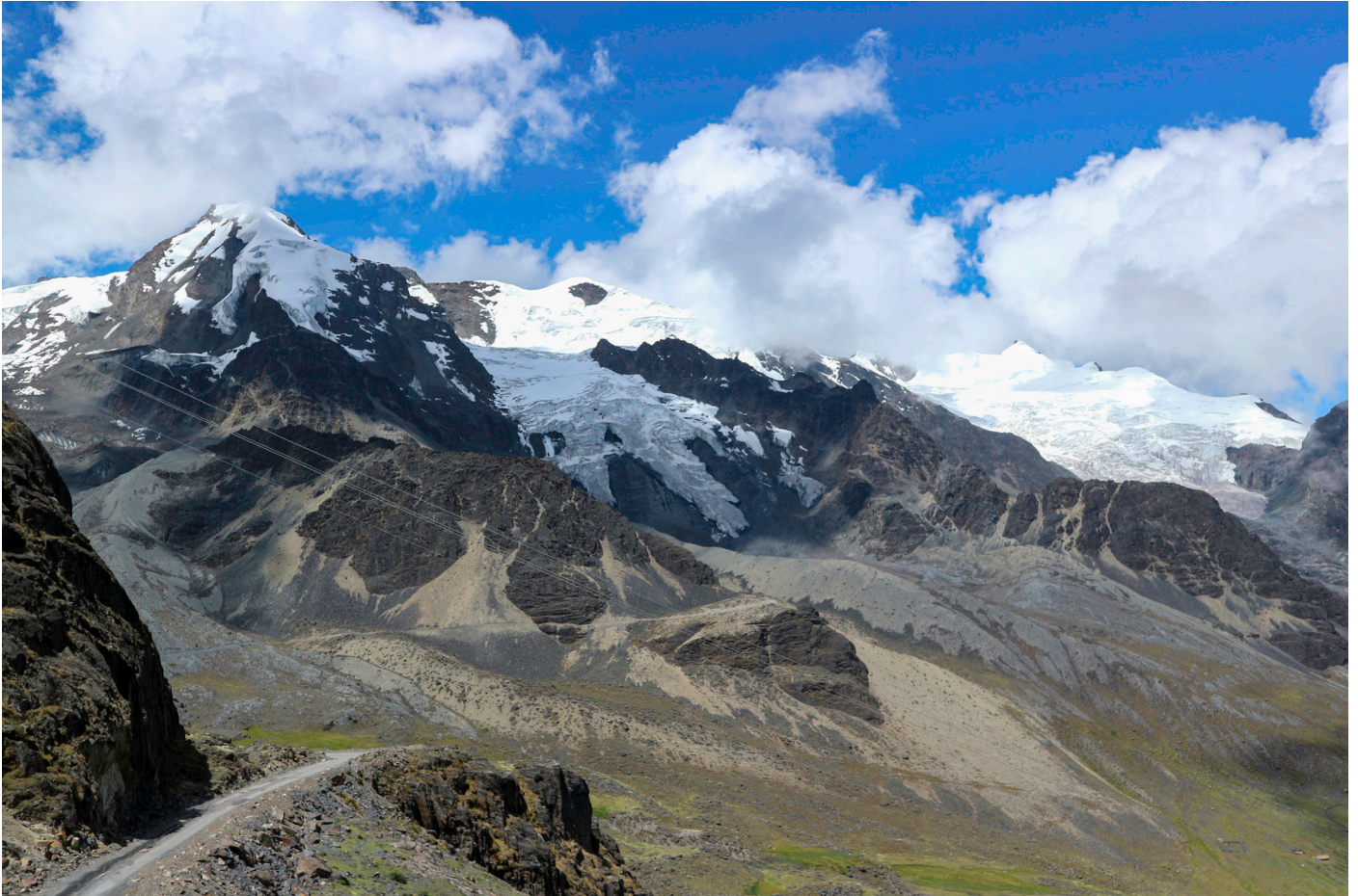
"Anden är med." På väg mot en bättre tillvaro i Bolivia.