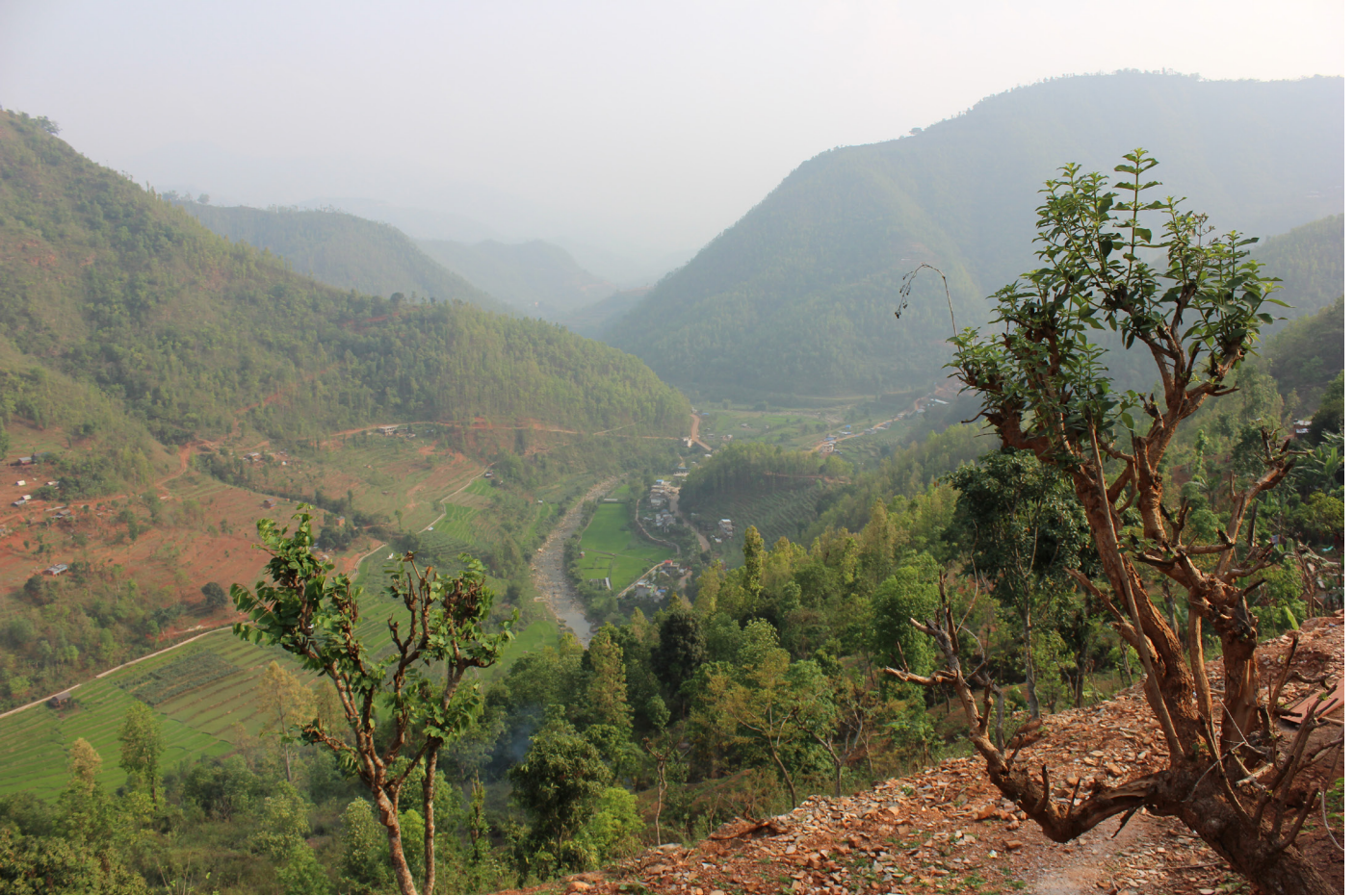
"Gud är nära." Utsikt från byn Nalang i länet Dhading, Nepal.