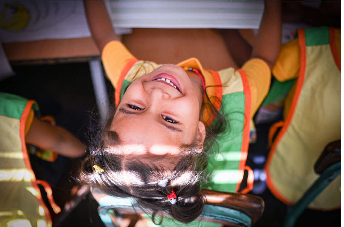
Victoria njuter av kreativt skapande vid kyrkans förskola Casa Amistad i Valencia, Venezuela.