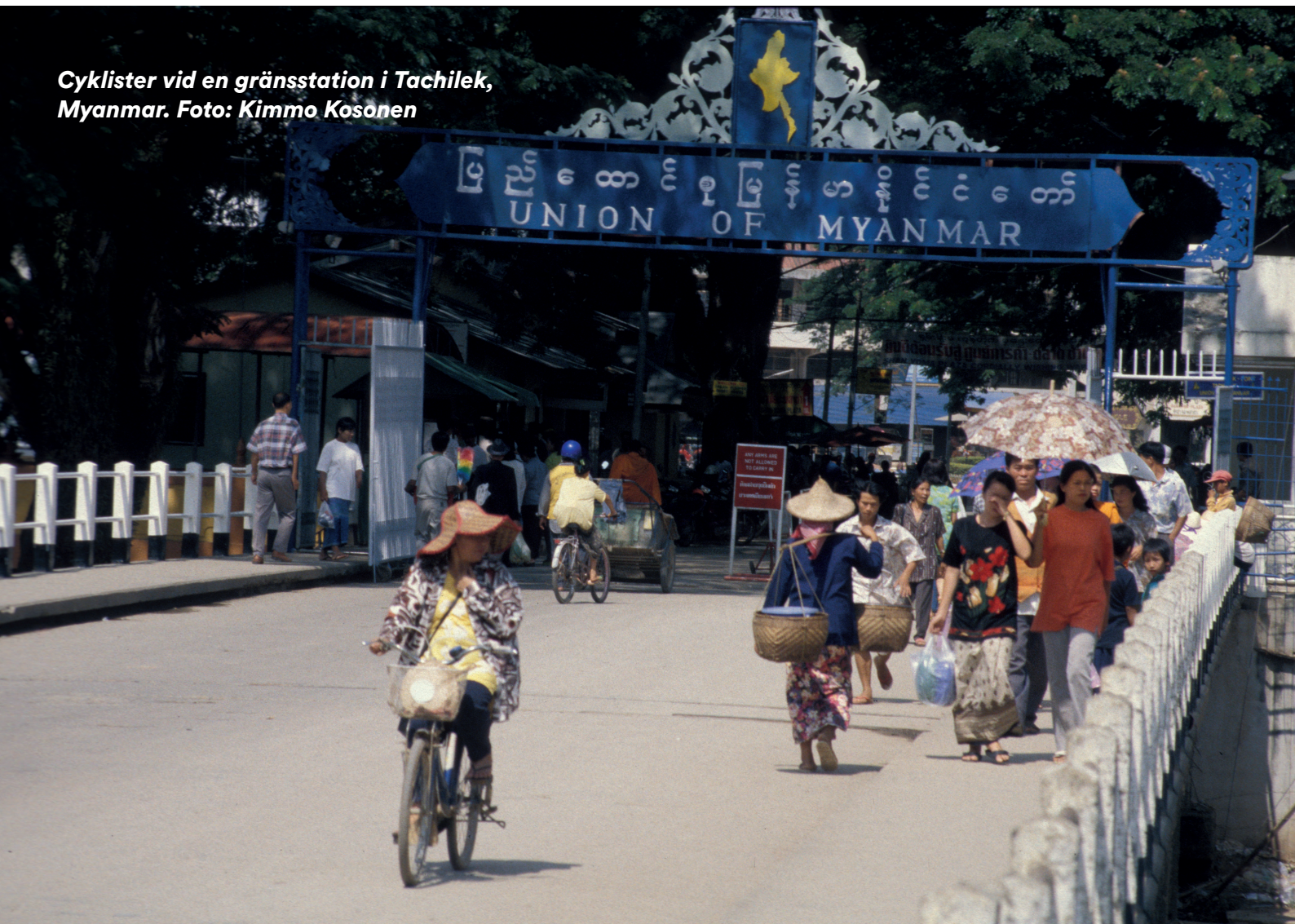
Cyklister vid en gränsstation i Tachilek, Myanmar.

I år fyller cykeln 210 år. Den moderna cykeln fyllde 140 år i fjol. Den moderna cykelns kanske största fördel var att den gjorde det möjligt för vanliga människor – människor som inte hade råd med andra färdmedel – att ta sig fram på egen hand. Särskilt viktig blev cykeln för kvinnor, som genom den fick en ny frihet och självständighet. Därför har cykeln ofta kallats ett frihetsfordon.