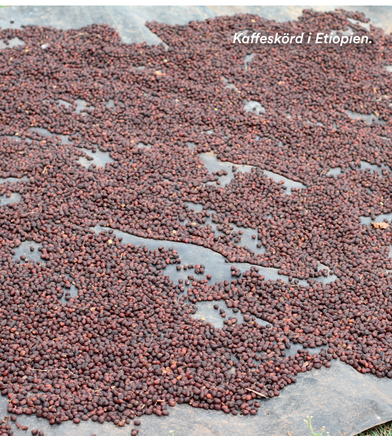
Kaffeskörd i Etiopien.