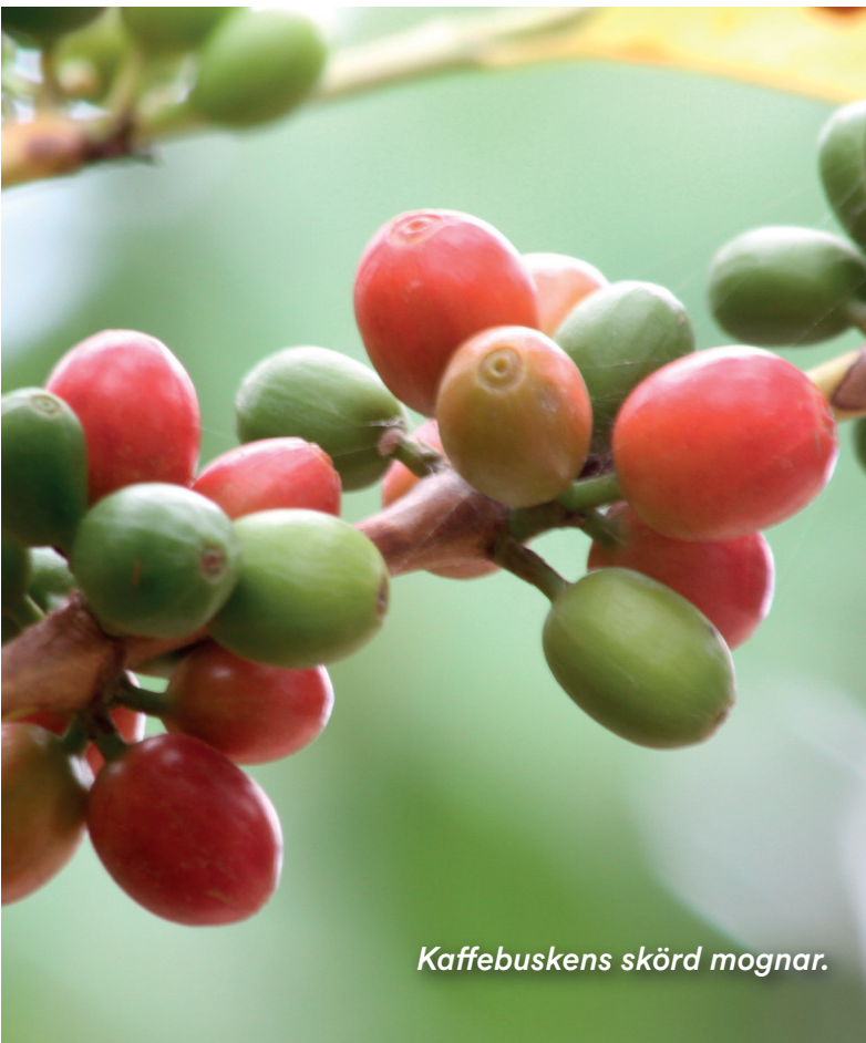
Kaffebuskens skörd mognar.

Ordet kaffe, som förekommer i relativt likande format i olika språk, anses allmänt komma från regionen Kaffa i Etiopien, där kaffebuskar växer. Alternativt sägs ordet härstamma från det arabiska ordet qahwa. Visste du att det endast i kaffets hemland Etiopien används ordet ”bunnä” eller ”buna” (ungefär ”böna”) för kaffe, medan ordet för kaffe i andra språk mer påminner om namnet Kaffa?