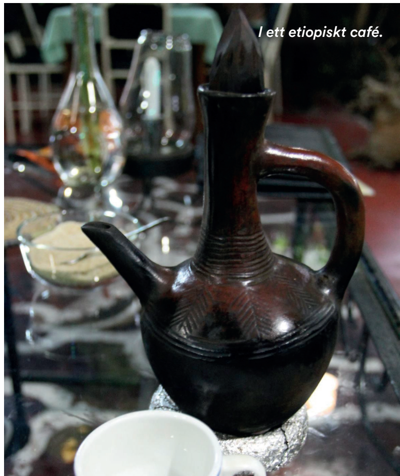
I ett etiopiskt café.